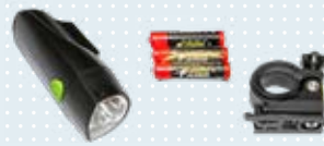
LED-Fahrradvorderlicht, weiß Art.-Nr. 493S164=SK007