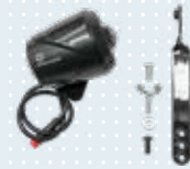
LED-Fahrradvorderlicht, integriert Art.-Nr. 493S164=SK008