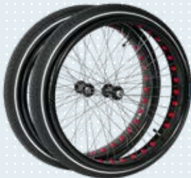
24" „Fat Wheels“, (12 mm-Achse) Art.-Nr. 493S164=ST020 24" „Fat Wheels“, (12,7 mm-Achse) Art.-Nr. 493S164=ST021