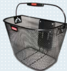
Korb 10 l (Art.-Nr. 493S164=ST010) Korb 16 l (Art.-Nr. 493S164=ST011) Halterung (Art.-Nr. 493S164=ST009)