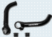
Lenkerhörnchen Art.-Nr. 493S164=PK002