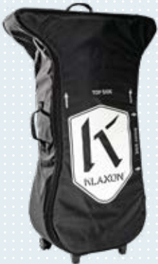
Flybag Transporttasche für Klick Power und Race Art.-Nr. 493S164=ST012