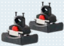
Traktionsgewichte Art.-Nr. 493S164=SK001 (x2)