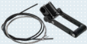
Lenkerverlängerung für Standard und Tetra-Lenker Art.-Nr. 493S164=ST003

Für das Klaxon-Klick-System bieten wir auch einige Options-Elemente an. Diese sind nicht nur praktische Begleiter im Alltag, sondern bieten dem Anwender erhöhte Sicherheit im Straßenverkehr.